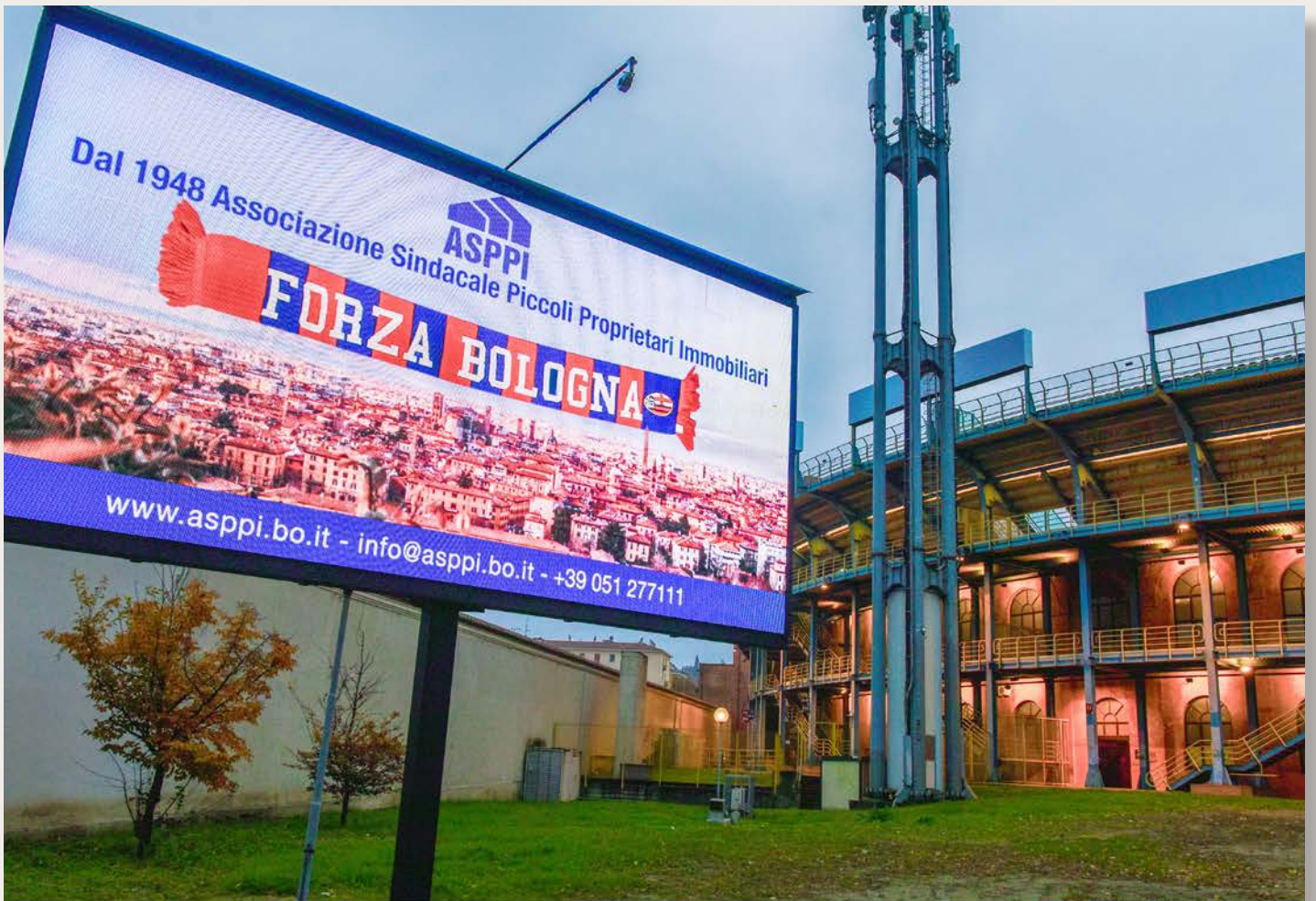
Maxi Schermo davanti allo Stadio di Bologna