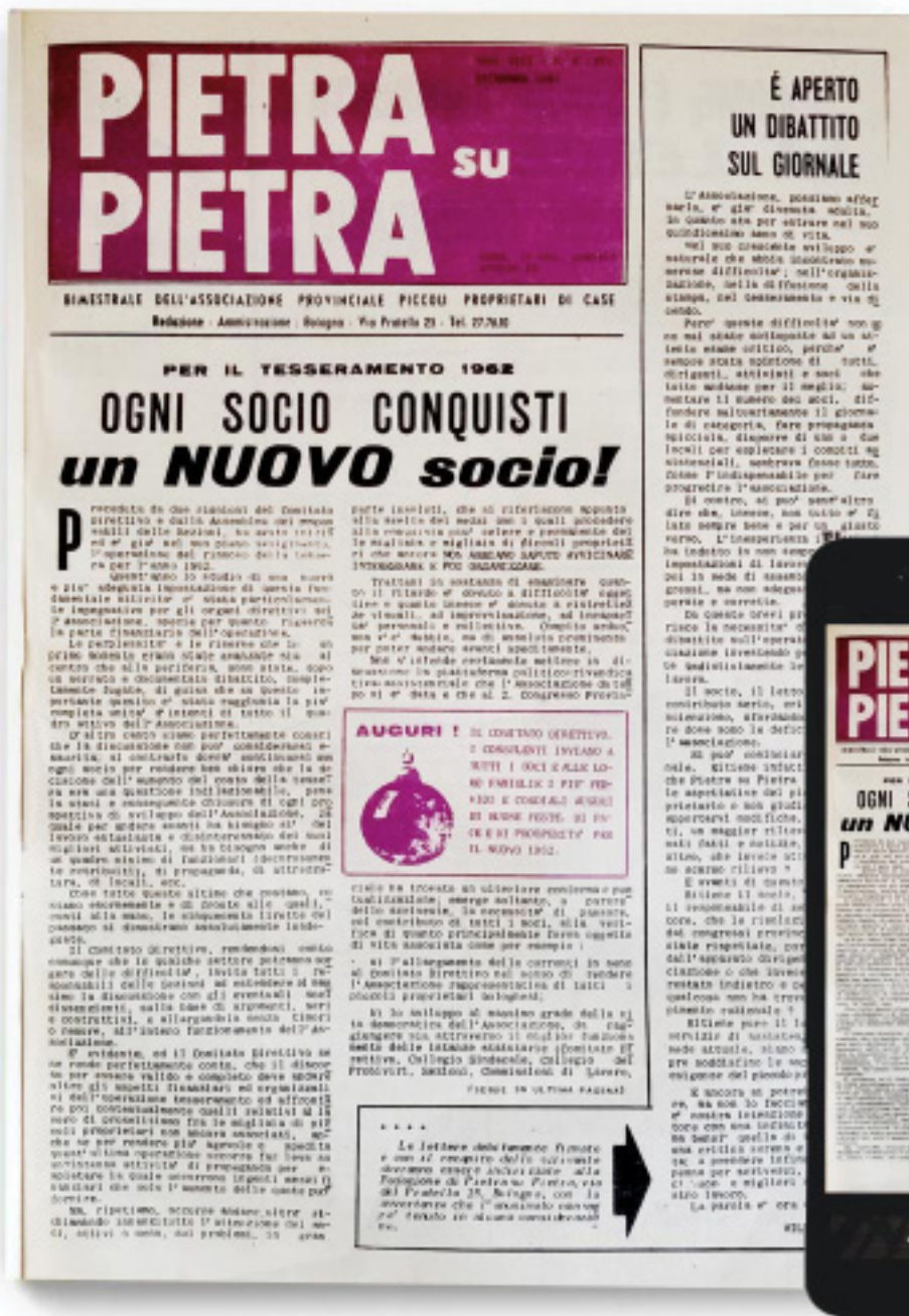
Pietra su Pietra 1961