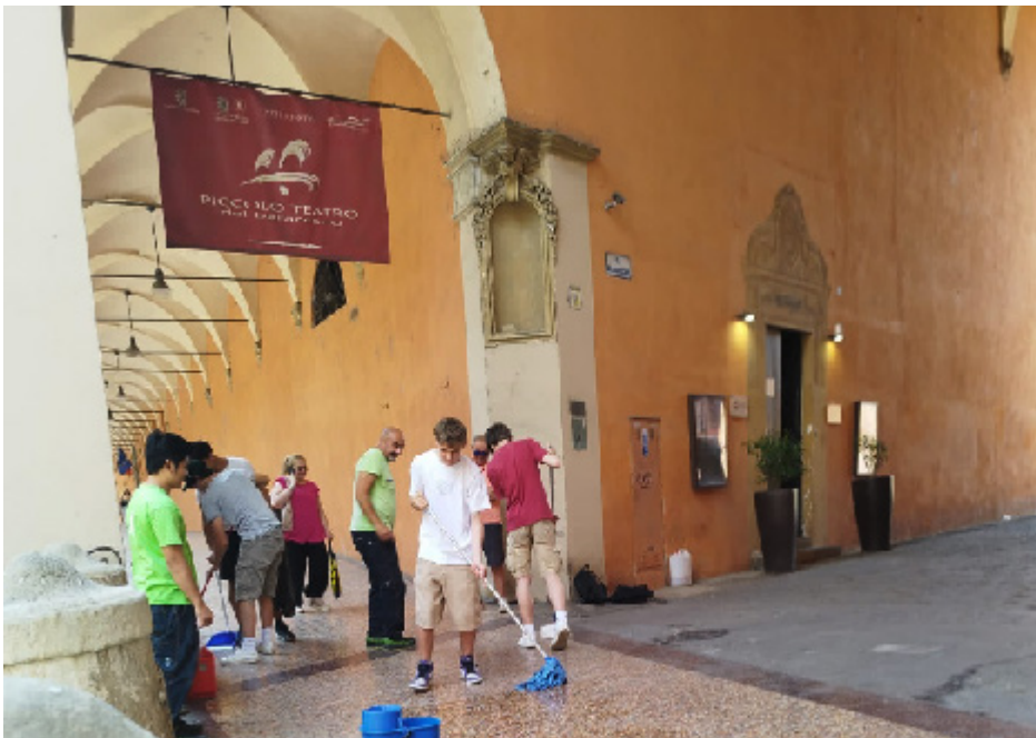
I ragazzi del Liceo Fermi affiancati degli operatori di Ambienta (azienda partner del progetto) stanno pulendo un tratto dei pavimenti dei Portici di Via S. Stefano