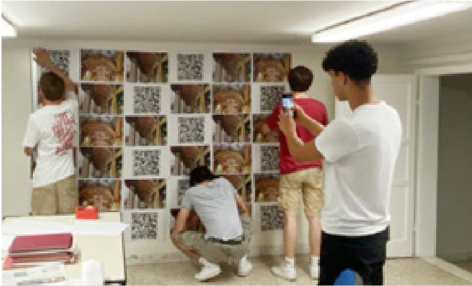
I ragazzi del Liceo Fermi "work in progress" sul primo prototipo del Poster Parlante "utile per valutare l'effetto reale" e "ragionare sulla realizzazione"